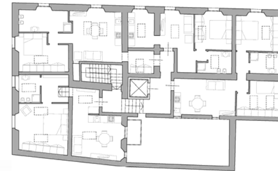
PLANIMETRIA PIANO SECONDO

La palazzina cielo-terra nel cuore di Piacenza sorge a pochi passi da Piazza Duomo, è stata completamente ristrutturata nel 2006 ed destinata ad un uso prettamente residenziale. I nove signorili appartamenti dei tre piani hanno finiture di lusso e arredi di design. Le metrature variano dai 70 mq. ai 100 mq.